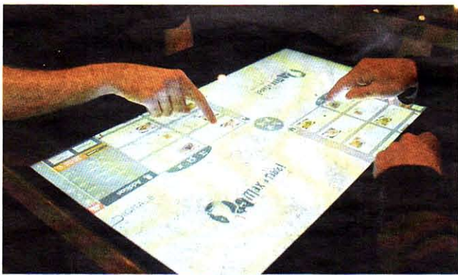
On peut commander, jouer et même manger sur les tables interactives